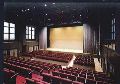
東京芸術センター 21階 天空劇場

7/21(土) 18:00 ~ 21階 天空劇場 (花火の打ち上げは19:30~20:30)