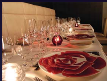
【写真】タピ ルージュ店内

東京芸術センター20F フレンチレストラン「タピ ルージュ」 演奏付きディナーコース 7,000円 (2ドリンク・コース料理)