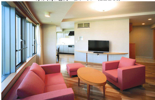
家具家電付 Eタイプ(1LDK)